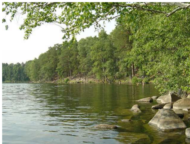
Берега озера Большой Сунукуль

Сегодня в ЮУрГУ 33 факультета и 145 кафедр в Челябинске, 13 филиалов в других городах. В университете и его филиалах обучаются около 45000 студентов (очная, очно-заочная, заочная формы обучения). Учебный процесс в университете и филиалах обеспечивают более 5000 преподавателей и сотрудников, в том числе более 350 профессоров, докторов наук, 1455 доцентов, кандидатов наук, 4 действительных члена РАН, 8 членов-корреспондентов РАН, 1 академик, 2 члена-корреспондента и 3 советника других государственных академий. Университетом к 2012 году выпущено 200 тысяч специалистов, 45 тысяч офицеров запаса, более 2600 кандидатов и 450 докторов наук.